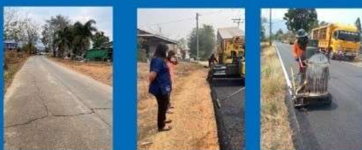
ภาพถ่ายระหว่างดำเนินการ