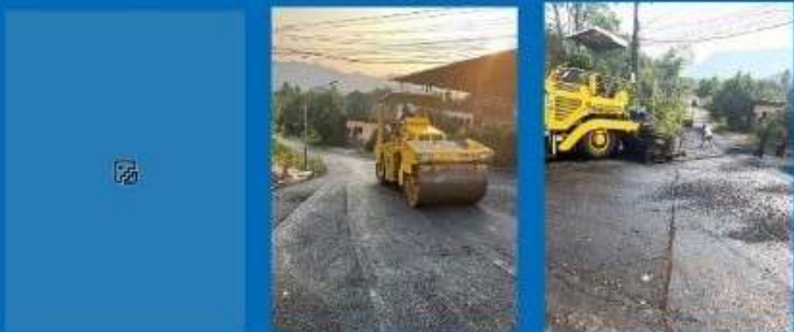
ภาพถ่ายระหว่างดำเนินการ