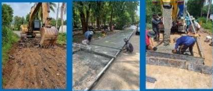
ภาพถ่ายระหว่างดำเนินการ